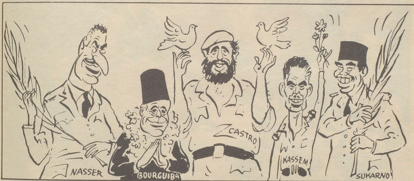
Seid friedlich - nehmt Euch ein Beispiel...

Auch der in den beiden zuletzt zitierten Briefauszügen geäußerte Wunsch soll in Erfüllung gehen. Ehe wir unter diese demokratische und echt nebelspalterische Aussprache den Schlußpunkt setzen, gewähren wir in einer nächsten Nummer einem Vertreter des Nationalen Informationszentrums Raum zu einem Nachwort. Der Nebelspalter