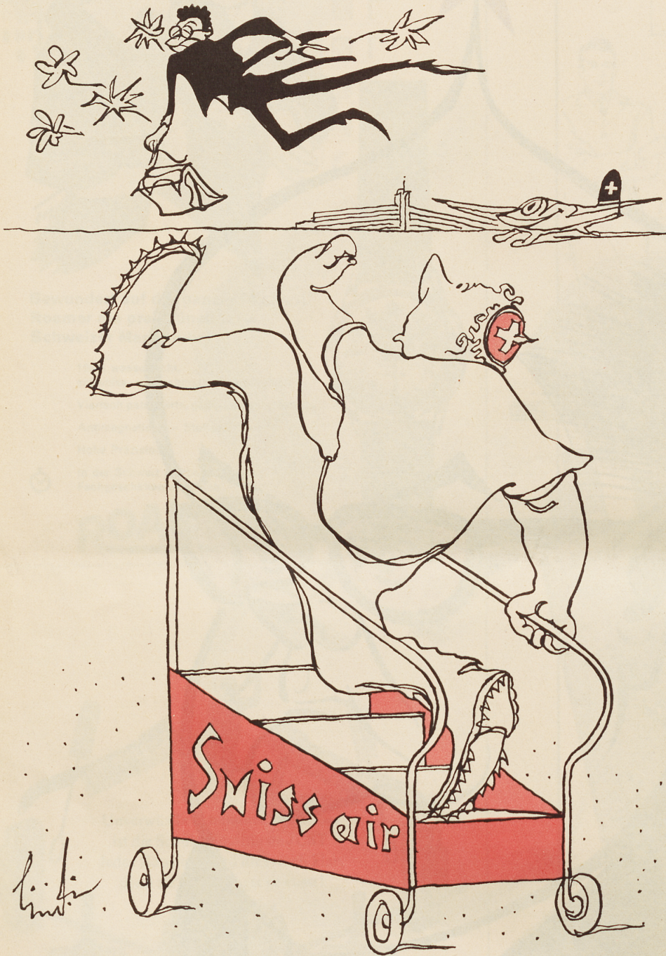
Wieder ein tschechischer Spion. Hier verweist er mit Diplomatenpaß.