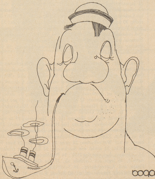
Seemann a. D.

Chruschtschow: «Gebe ich nicht das beste Beispiel für praktische Abrüstung!? Habe ich doch schon 19 meiner H-Bomben vernichtet!