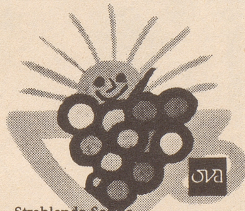
Strahlende Sonne edle Trauben herrlicher Saft, sein Name ist MERLINO

Glückliche Schweiz, denn schweizerischer Lärm würde hier wohl als Stille empfunden! Georg St., Santiago