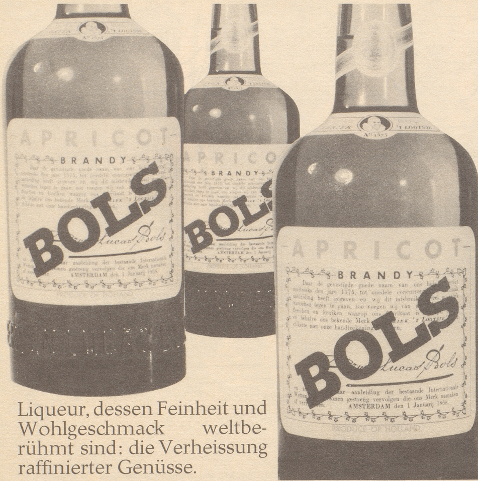
E. Oehninger A.G., Montreux, Generalvertreter für die Schweiz

Liqueur, dessen Feinheit und Wohlgeschmack weltberühmt sind: die Verheissung raffinierter Genüsse.