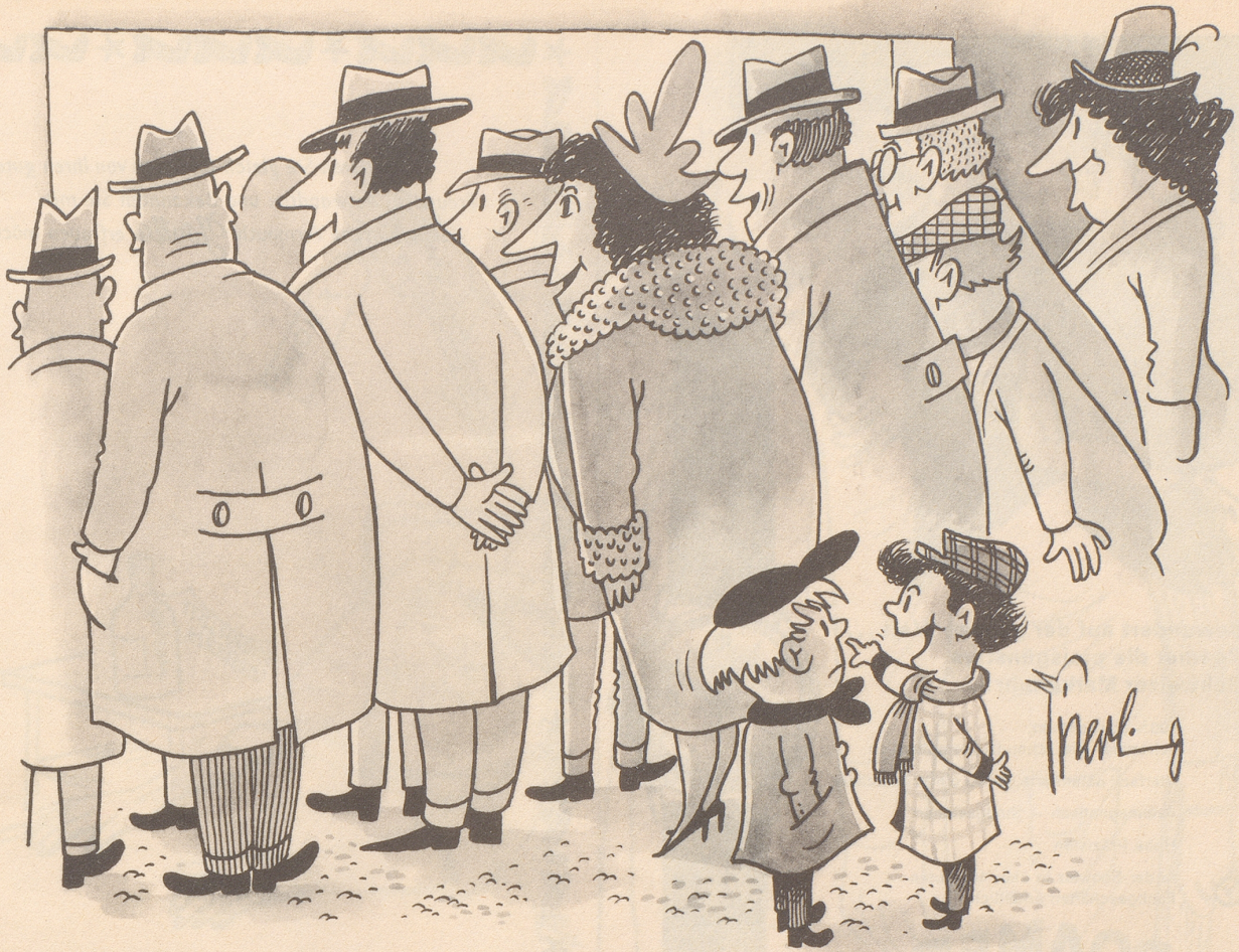
«Du da häts sicher Schpielsache.»