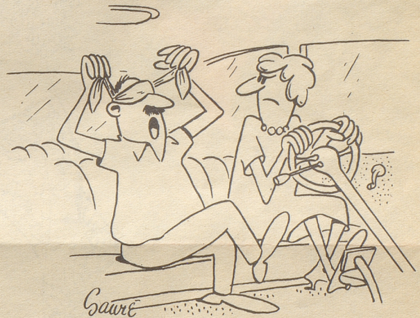
«So, ich bi parad, fahr los!»

in der Kinopause zu Salamireklame, Quartiergeklatsch, Bodenwichseanpreisungen und Schokoladenschmatzen einfach unerträglich! Wenn Gershwin im Künstlerhimmel gehört hat, wie ein sonst ruhiges und würdiges Kinopublikum sich benahm – ich bin sicher, daß er dann geschmunzelt hat! Gibt es doch, wie mir scheint, nicht leicht ein schöneres Kompliment für einen Komponisten als der Ruf des Kinopublikums, seine Werke als Pausenmusik abzusetzen!