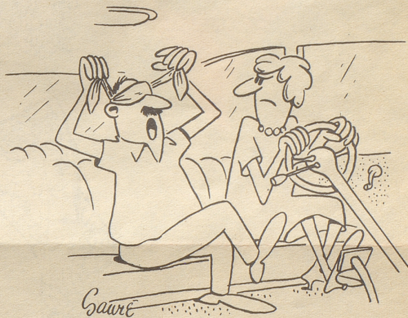
«So, ich bi parad, fahr los!»

in der Kinopause zu Salamireklame, Quartiergeklatsch, Bodenwichseanpreisungen und Schokoladenschmatzen einfach unerträglich! Wenn Gershwin im Künstlerhimmel gehört hat, wie ein sonst ruhiges und würdiges Kinopublikum sich benahm – ich bin sicher, daß er dann geschmunzelt hat! Gibt es doch, wie mir scheint, nicht leicht ein schöneres Kompliment für einen Komponisten als der Ruf des Kinopublikums, seine Werke als Pausenmusik abzusetzen!