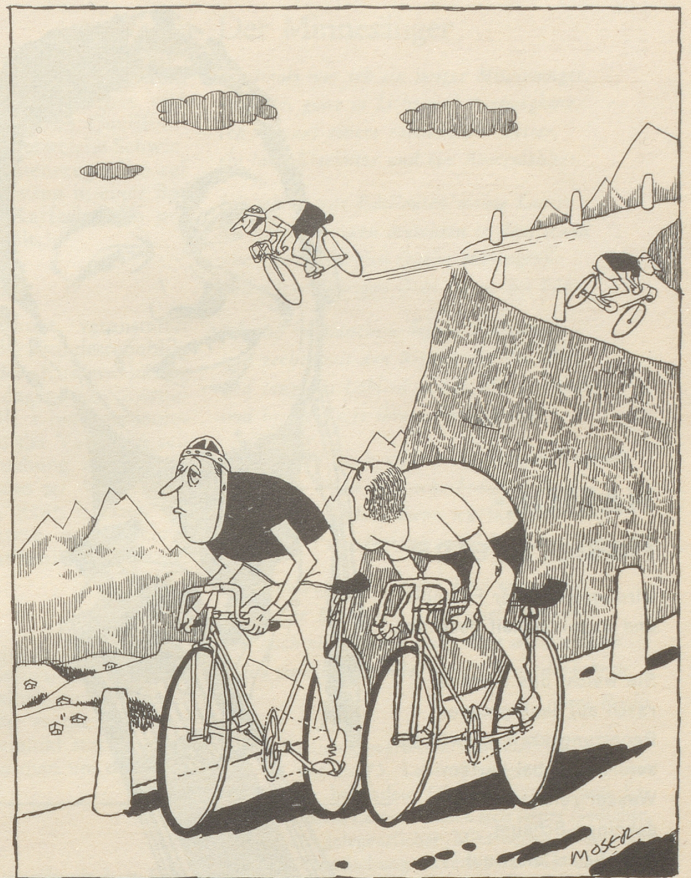
«Das ist ein früherer Bahnspezialist und Schweizermeister im Fliegerrennen! Man nannte ihn den Düsenjäger ...»

Als der Maler Ferdinand Hodler endlich finanziell auf einen grünen Zweig kam, standen langjährige Gewohnheit und angeschlagene Gesundheit einem üppigeren Lebenswandel im Wege. «Man kann halt nicht nachessen», sagte Hodler melancholisch. fh