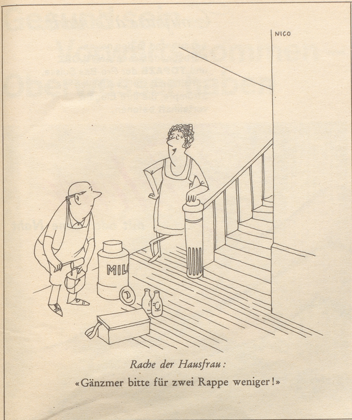
Rache der Hausfrau: «Gänzmer bitte für zwei Rappe weniger!»