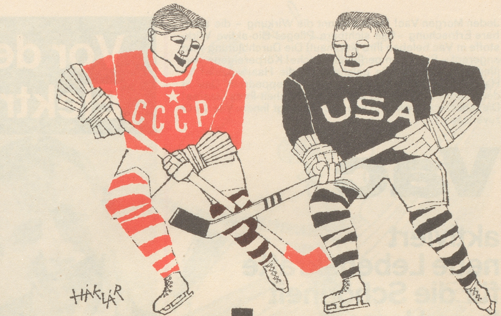
Der kalte Krieg