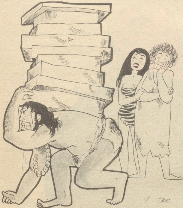
«Bärentatzers nebenan haben wieder eine Menge Neujahrskarten erhalten.»