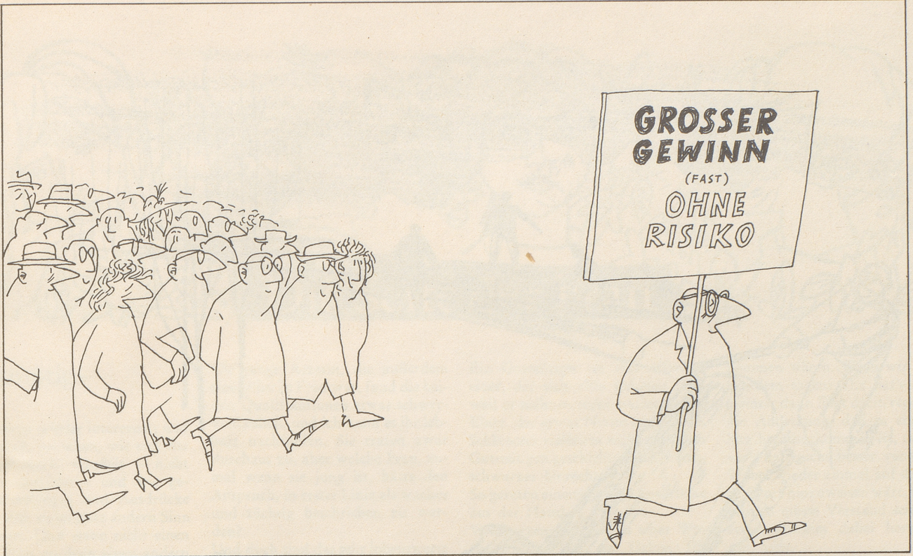
Gar mancher sucht im Geld sein Heil . . .