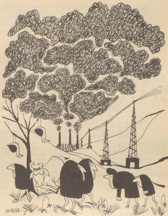
Mit Oel betriebene thermische Kraftwerke stoßen mit dem Rauchgas Schwefeldioxyd ab, das für Menschen, Tiere und Pflanzen schädlich ist.