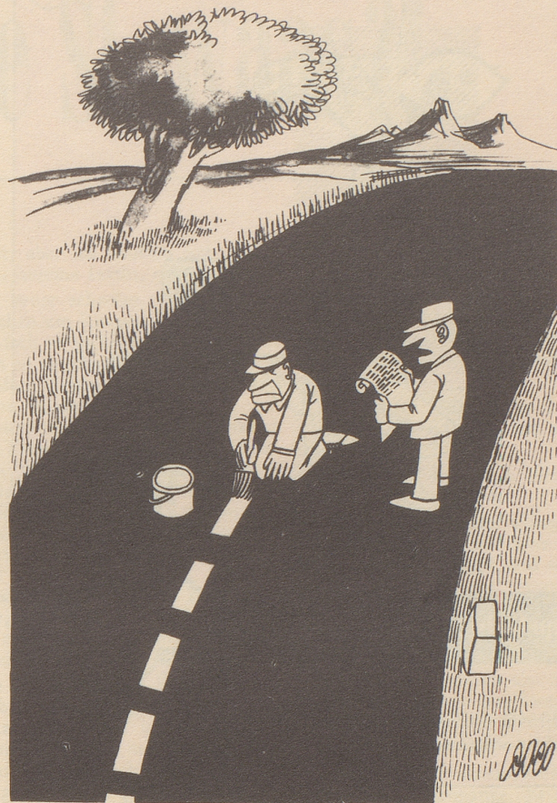
«... Linie — Zwischenraum — Linie — Zwischenraum...»