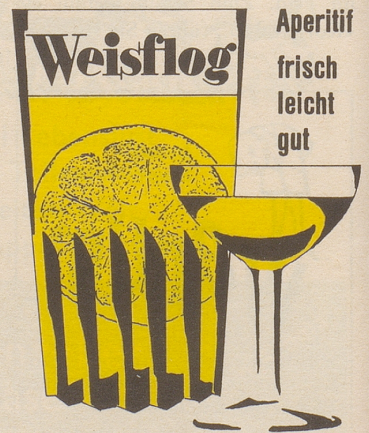
G. Weisflog & Cie. 8048 Zürich-Altstetten