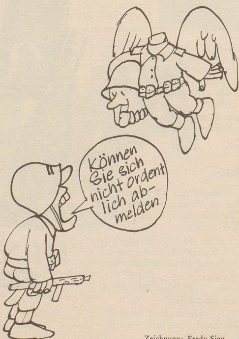
Zeichnung: Fredy Sigg

Unsere Dätel mühen sich vergessens, ihre müden Blicke zu besag-