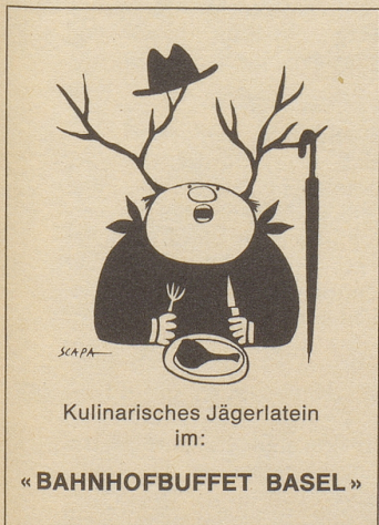
Kulinarisches Jägerlatein im:

Ich muß Ihnen sagen, liebe Automobilisten unter den Lesern: gehen Sie nie zu ausländischen Garagen! Die verstehen einfach nichts von ihrem Fach.