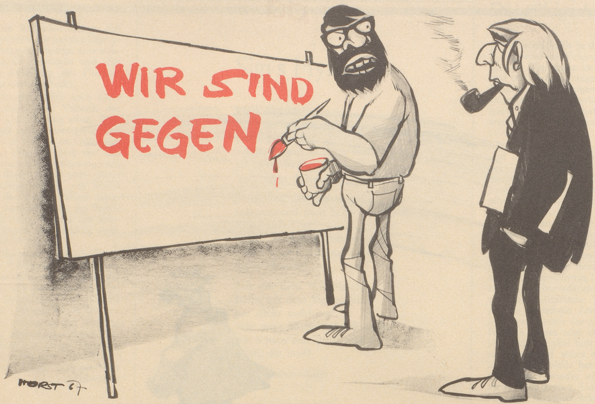
«... wogegen heute?»