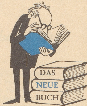
Ein Silberstreifen mit Silberbüchern

DIE EINZIGE MARKE * DIE 1966 * IHREN VERKAUF VERDOPPELTE