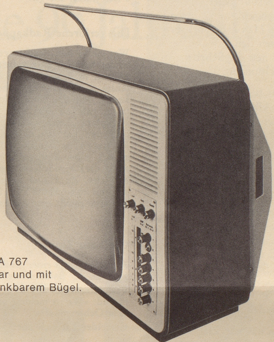
WEGA 767 tragbar und mit versenkbarem Bügel.

Sehen Sie: Dies ist der Fernseher für Fernseh- Individualisten (Lesen Sie warum...)