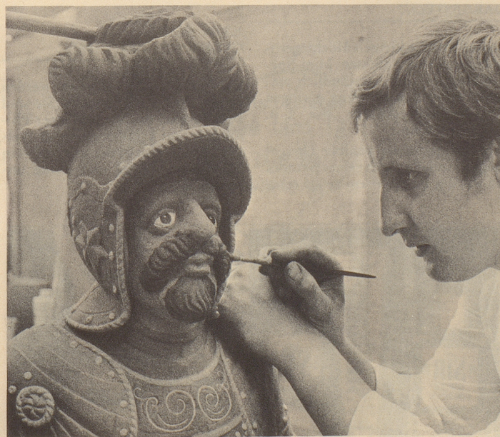
Make up — not war!

So richtet sich der hehre Revolutionsgesang in ein Hohn- und Spottlied gegen sich selbst. bi