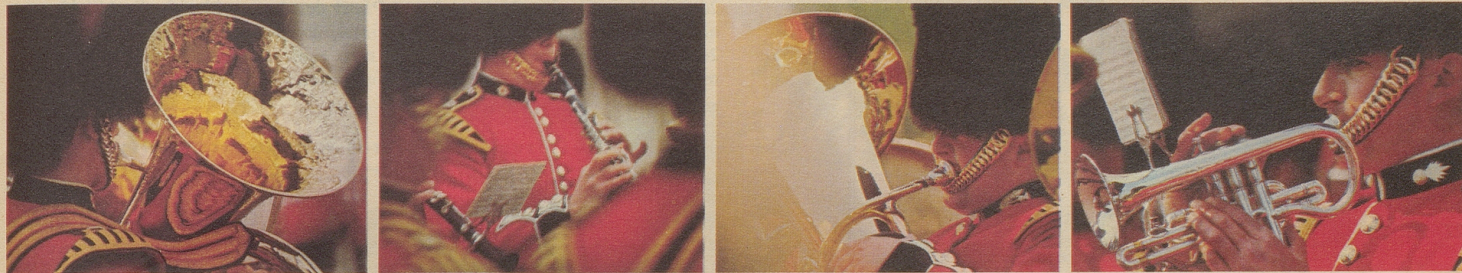
Die berühmte Band der Grenadier Guards auf dem Marsch über die Mall.

London ehrt seine berühmten Männer mit Gedenktafeln an den Häusern, in denen sie lebten. Erstaunlich, wie viele man schon auf einem kurzen Bummel entdeckt.