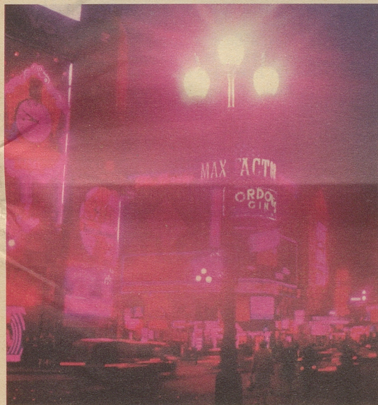
Glanz-Lichter: Der Piccadilly Circus ist der Mittelpunkt Londons. Von hier führen alle Wege ins Vergnügen: Zu den Theatern – zu den Nachtclubs in Soho – zur nahen Bond Street, dem exklusiven Einkaufszentrum.

Portobello Road: Der aufregendste, ungewöhnlichste aller Londoner Märkte. Occasionen zu Aberdutzenden. Antiquitäten zu Hunderten. Preise für jedes Budget. Und wenn Ihnen Antiquitäten nicht zusagen: Hören Sie zu, wie Käufer und Händler miteinander feilschen.