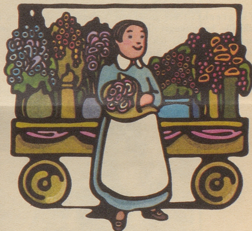
Märkte im Freien: London ist gesteckt voll von Märkten. Sehr günstig einkaufen können Sie in der Petticoat Lane. Antike Möbel in Massen finden Sie in Bermondsey.

Der Bobby – Ihr Freund und Helfer. Eine unentbehrliche Institution, wenn Sie nicht mehr weiter wissen. Verlangen Sie die British Travel Broschüre «London»: Sie zeigt Ihnen, was Sie alles sehen und tun können. Der Londoner Bobby zeigt Ihnen, wie Sie hinkommen.