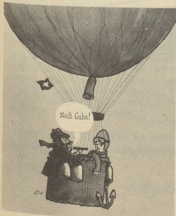
Jüsp in Nebelspalter, Switzerland