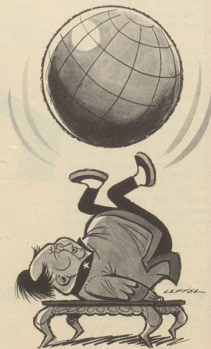
... Maos Weltmachtträume