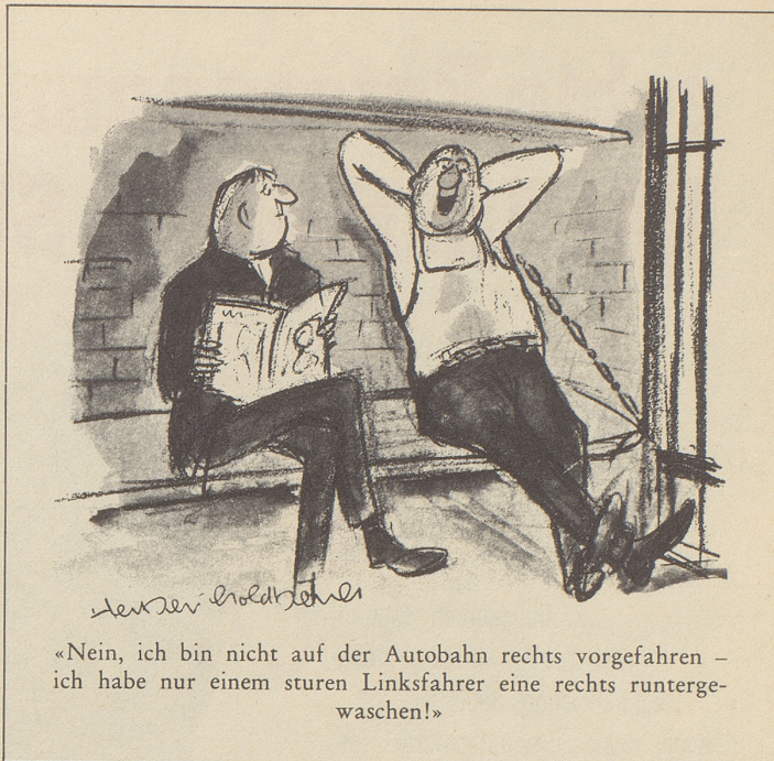
«Nein, ich bin nicht auf der Autobahn rechts vorgefahren – ich habe nur einem sturen Linksfahrer eine rechts runtergewaschen!»

Im kommenden Herbst wird auch auf dem Büchermarkt kräftig Kapital geschlagen aus der Mondlandung – ganze Reihen von Mondbüchern sind angesagt. Hoffentlich ist das Gegenstück zu dieser ebenfalls vom Mond verursachten Flut dann nicht eine geistige Ebbe.