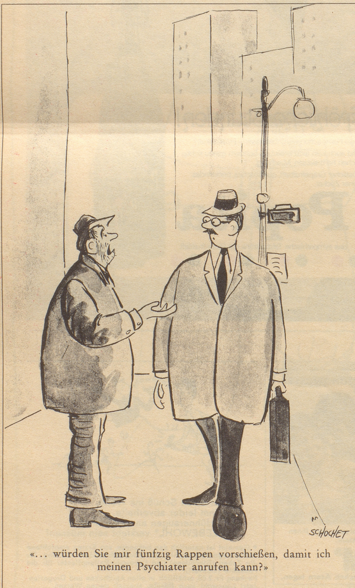
«... würden Sie mir fünfzig Rappen vorschießen, damit ich meinen Psychiater anrufen kann?»