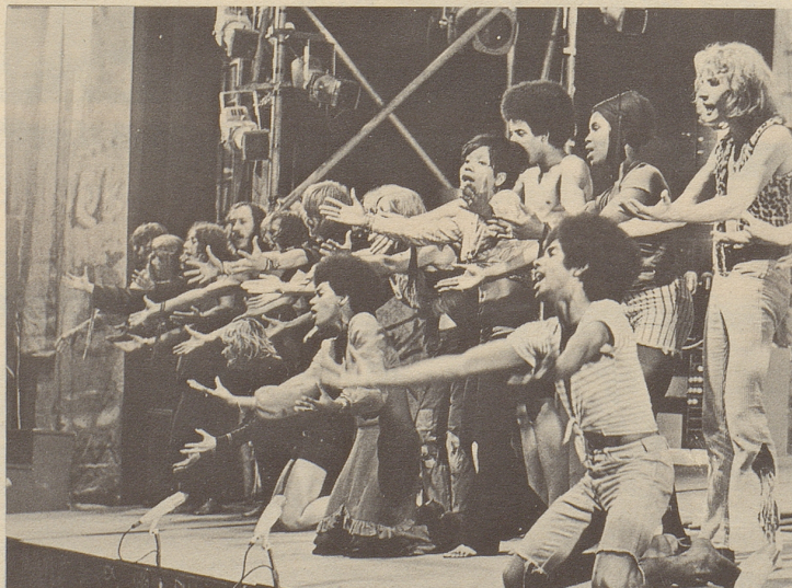
Hippie-Finale: «Laßt den Sonnenschein in euch hinein ...!»

Und daß ich's nicht vergesse: als «Hair»-Besucher im Zürcher Volkshaus werden Sie, liebe Leser, nach dem musikalisch schönen «Laßt den Sonnenschein in euch hinein!» rund um den toten Claude in Uniform, der schließlich der Hippie-Weltanschauung doch untreu geworden und als Soldat in Vietnam gefallen ist, zu einem «Dance-In» auf der Bühne animiert, wo Sie sich wild schwofend unter die Darsteller mischen dürfen, ja sollen. Das Premierenpublikum machte nicht so recht mit; aber Sie können es ruhig riskieren. Diese Miteinbeziehung des Publikums als «Hair»-Ausklang geht auf einen Wunsch des Produzenten und Schweizers Werner Schmid zurück, der vom Publikum auf der Bühne einst sagte: «Es wird ebenfalls den Wunsch haben, sich auszuziehen, alles Belastende von sich zu werfen.» Diese Prophezeiung hat sich in der Zwischenzeit als voreilig erwiesen. Ein Massenstriptease ist also nicht zu befürchten.