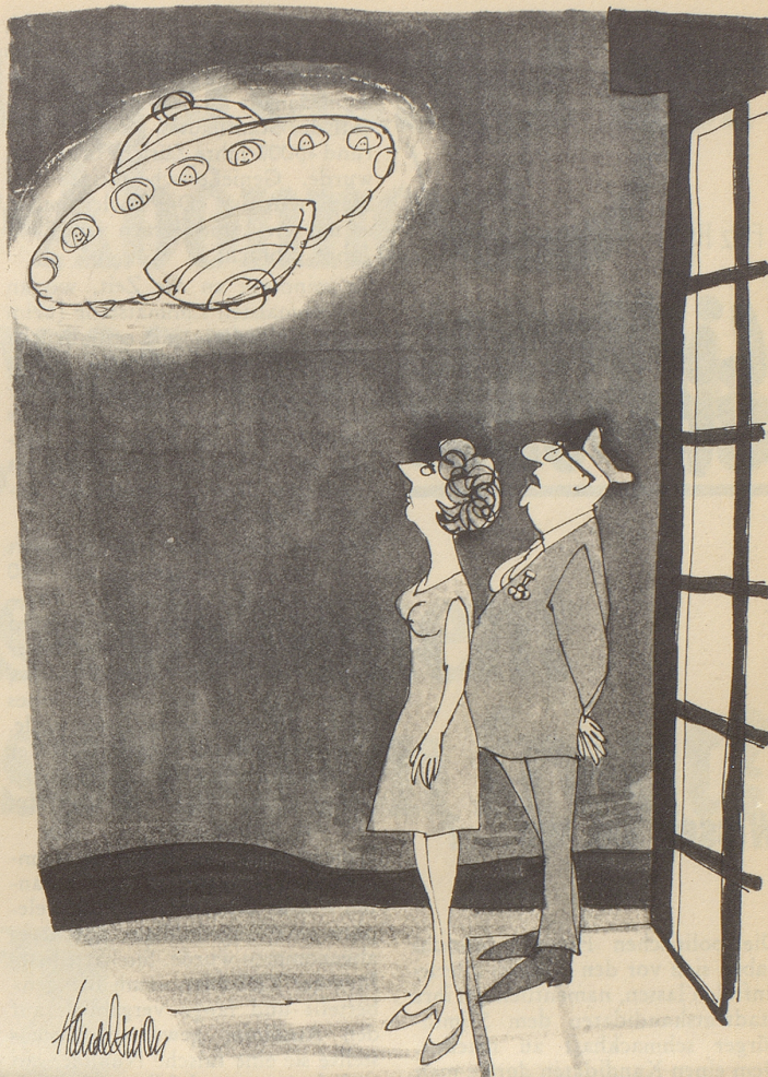
«... ich würde es melden, wenn ich nicht überall als Witzbold bekannt wäre!»

Wie, bitte? – O nein, wir spinnen nicht. Wir ließen lediglich unsere guten Sitten durch schlechte Bei-