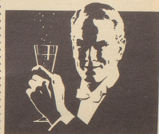
Ihr Sekt für frohe Stunden