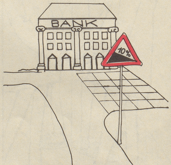
Alther Christoph Lärchenstraße 9, 9230 Flawil