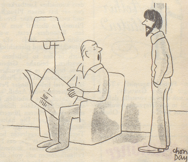
«Suchst du, wie der Bundesrat, wieder einmal deine übliche Einnahmen-Quelle auf?»