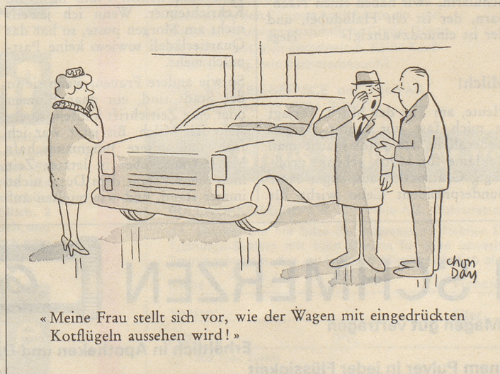
«Meine Frau stellt sich vor, wie der Wagen mit eingedrückt Kotflügeln aussehen wird!»