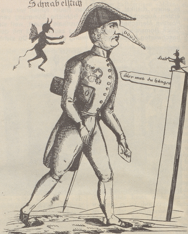
Metternichs abreise von Wien mit Schnabelfisch

zieht ab mit seinen Millionen da er selbst entsieht daß er sein Vaterland betrogen hat.