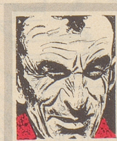
Us em Innerrhoder Witztröckli

Auf einer Elternversammlung der Schule wird gefragt: «Wie erziehen Sie Ihre Kinder?» Ein junger Vater meldet sich zu Wort: «Ich tue einfach so, als wären die Kinder nicht von mir.» – «Was hat das mit der gestellten Frage zu tun?» – «Das ist ganz einfach: wie fremde Kinder erzogen werden müssen, das weiß doch jeder!» tr