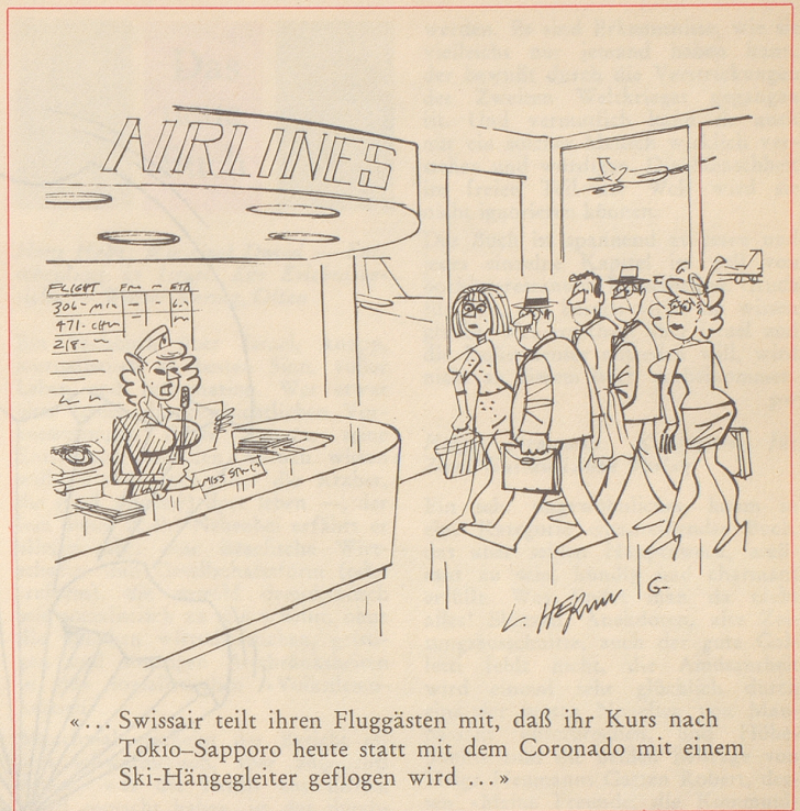
«... Swissair teilt ihren Fluggästen mit, daß ihr Kurs nach Tokio-Sapporo heute statt mit dem Coronado mit einem Ski-Hängegleiter geflogen wird ...»

Ich muß Ihnen vielleicht noch sagen, wer Emil Jannings ist. Mag ja sein, daß einige von Ihnen den Fehler gemacht haben, Kuli vorzuziehen. (Es gibt ja auch Leute, die den «Blauen Engel» nicht gesehen haben.) Emil Jannings war ein großer Schauspieler. Er hat außer dem «Blauen Engel» mit dem Regisseur Josef von Sternberg noch weitere Filme gedreht. 1928 erhielt er als erster Schauspieler den «Oscar». Nach 1933 drehte er nur noch elf Filme. Darunter 1935 «Traumulus», nach einem Stück von Arno Holz. Traumulus setzte das ZDF gegen Kulenkampff ein. Machen Sie sich nun aber keine Sorgen, wenn Sie vielleicht Traumulus verpaßt haben. Jannings können Sie in den nächsten Monaten doch noch kennenlernen (oder wiedersehen). Das ZDF wird nämlich zwei weitere Janningsfilme aus dem Archiv holen. Was immer auf den anderen Kanälen läuft, verpassen Sie es nicht, wenn am ZDF «Der zerbrochene Krug» und «Altes Herz wird wieder jung» gezeigt wird. Telespalter