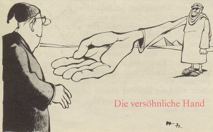
Die versöhnliche Hand

Auskünfte und Zeichnungsscheine erhalten Sie vom Aktionssekretariat der Pro Infirmis, Postfach 238, 8032 Zürich, Telefon 01 47 96 96.