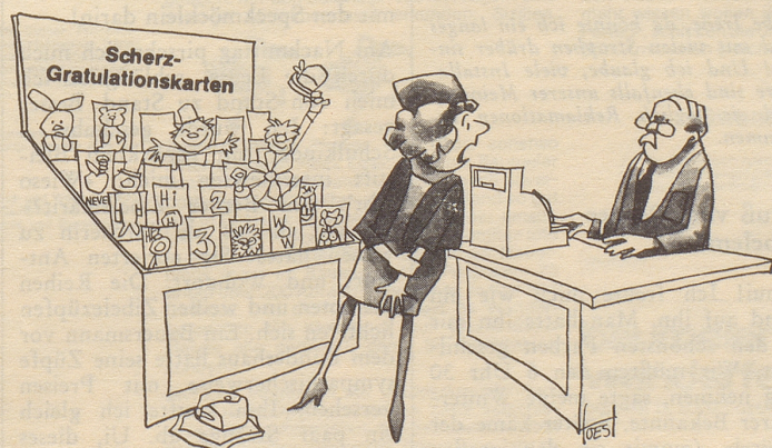
«Eine hat mich soeben gebissen!»

Viele Jahre lang hat er mir eifrig geholfen, gute Süppchen, Braten,