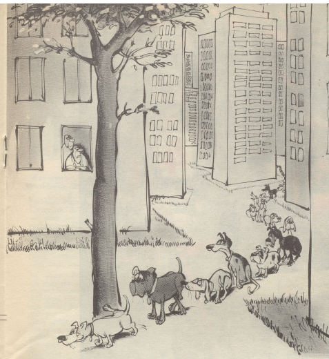
«Entsieden zu wenig Bäume in diesem Viertel!»