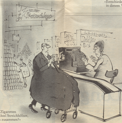
«Ein Päckchen Zigaretten und eine Schachtel Streichhölzer, was macht das zusammen?»