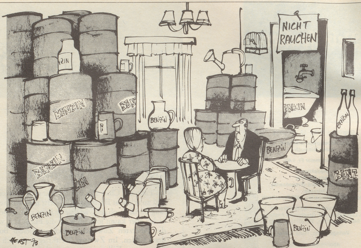
«Nun würde ich mich aber doch ärgern, wenn die Araber nicht hart blieben!»