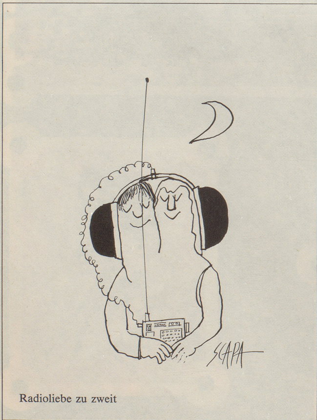
Radioliebe zu zweit

schränkung erst der wahre Meister. Ist von der Beschränkung zur Beschränktheit auch nur ein Schritt, so überlasse man letztere getrost der SFRV. Es ist nicht einzusehen, weshalb zu den von Major Cincera immer wieder erwähnten 400 subversiven Organisationen im Lande noch eine 401., rechtssubversive, hinzukommen soll. Wenn dabei das Radio, obwohl es wahrscheinlich die progressivere Richtung vertritt, seltener der Destruktion bezichtigt wird als das Fernsehen, so mag das einfach daher rühren, dass ihm die durch die oben erwähnten elektromagnetischen Wellen erzeugte Dimension der optischen Signale fehlt. Mit anderen Worten: Die nüchterne Erwähnung des Radiosprechers, der amerikanische Präsident habe vor dem Untersuchungsausschuss erneut beteuert, er hätte vom Einbruch in Watergate keine Ahnung gehabt, stimmt den gouvernemental eingestellten Bürger weniger bedenklich, als wenn zur selben Notiz auf dem Bildschirm gleichzeitig die Foto eines mit den Tränen kämpfenden Nixon erscheint, die alleine schon durch ihren Anblick das Misstrauen ei-