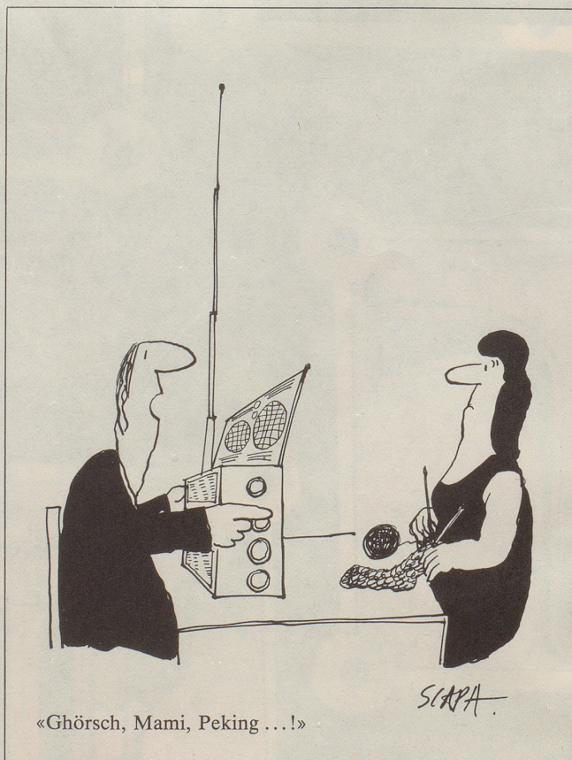
«Ghörsch, Mami, Peking ...!»