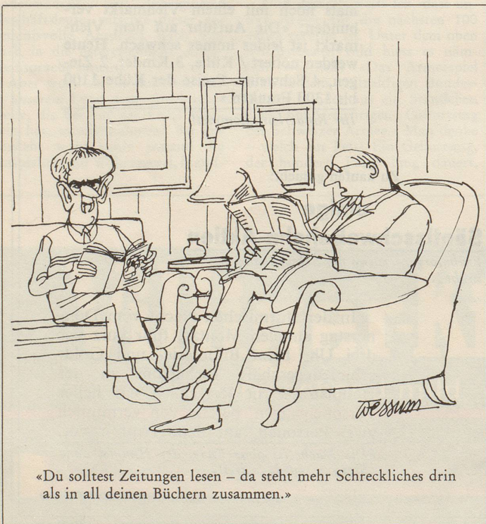
«Du solltest Zeitungen lesen – da steht mehr Schreckliches drin als in all deinen Büchern zusammen.»