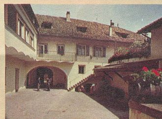
Hof einer typischen Südtiroler Weinkellerei