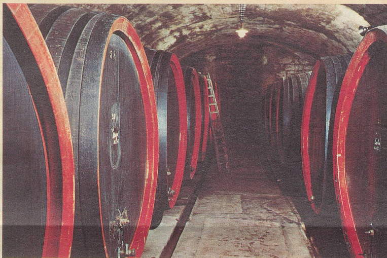
In grossen Fässern aus edlen Hölzern reift der Wein seiner Blüte entgegen

St. Magdalena hat dem Wein aus der Umgebung seinen Namen geschenkt