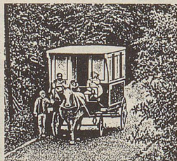
1976: Romanische Kunst in Poitou-Charentes-Vendée

Verstopfung – eine weit verbreitete Erscheinung – hat ihre Wurzeln wohl in unserer zivilisierten Lebensweise. Mangel an körperlicher Bewegung, Automation, dazu Ernährungsgewohnheiten, die unsere Verdauungsorgane nicht mehr voll beanspruchen... Hauptbestandteile von Pfarrer Kneipps Wörissetten sind die kombinierten Wirkstoffe bewährter Heilpflanzen wie Aloe, Kalmus, Wacholderbeere, Brennessel und Blasantang. Diese Kombination erzielt eine angenehme Abführwirkung, hilft den Körper mild zu entwässern und zu entschlacken. In Apotheken und Drogerien