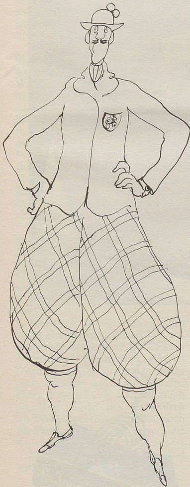
Aus England kommt dieser neue Golfanzug.

Eine kleine Auswahl aus dem überreichen Angebot von Mode-Neuheiten bringt der Nebelspalter im Vorabdruck. Fredy Sigg recherchierte in den grossen Modehäusern von London, Paris und Rom.