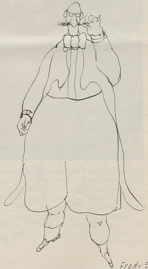
Hot-Pants für Bälle bringt wiederum England.