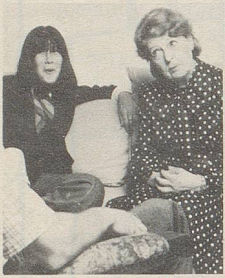
... beim Sprechen