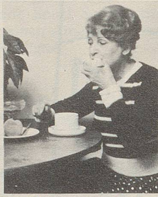
... beim Essen

Smig ist ein spezielles Haftkissen aus weichem Plastik, das leicht einzusetzen ist als Polster zwischen Kiefer und Prothese.