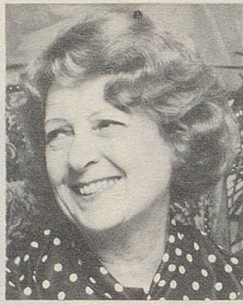
... beim Lachen