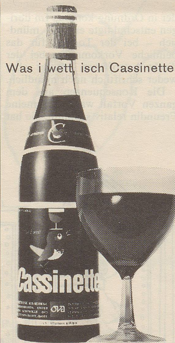
Was i wett isch Cassinette