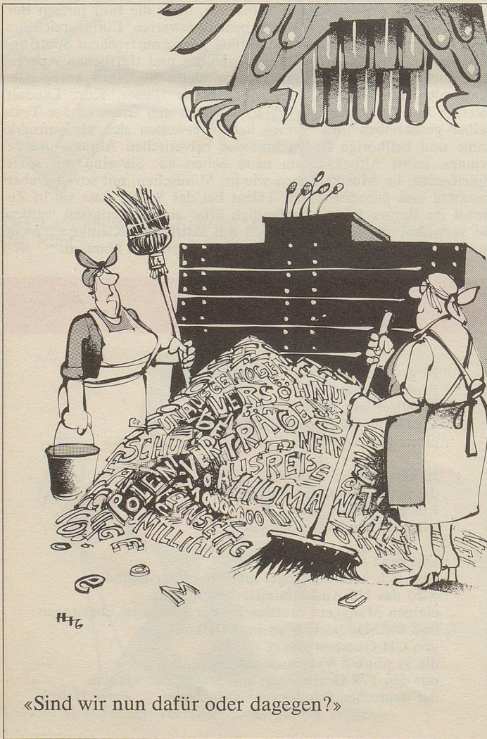
«Sind wir nun dafür oder dagegen?»