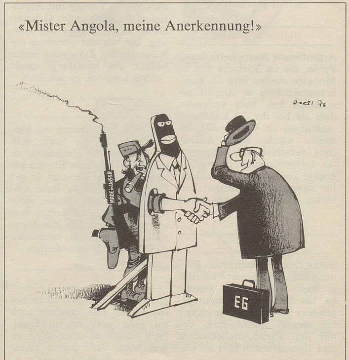
«Mister Angola, meine Anerkennung!»