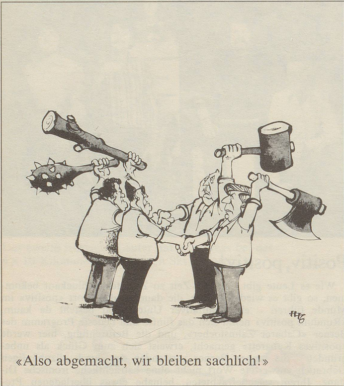
«Also abgemacht, wir bleiben sachlich!»