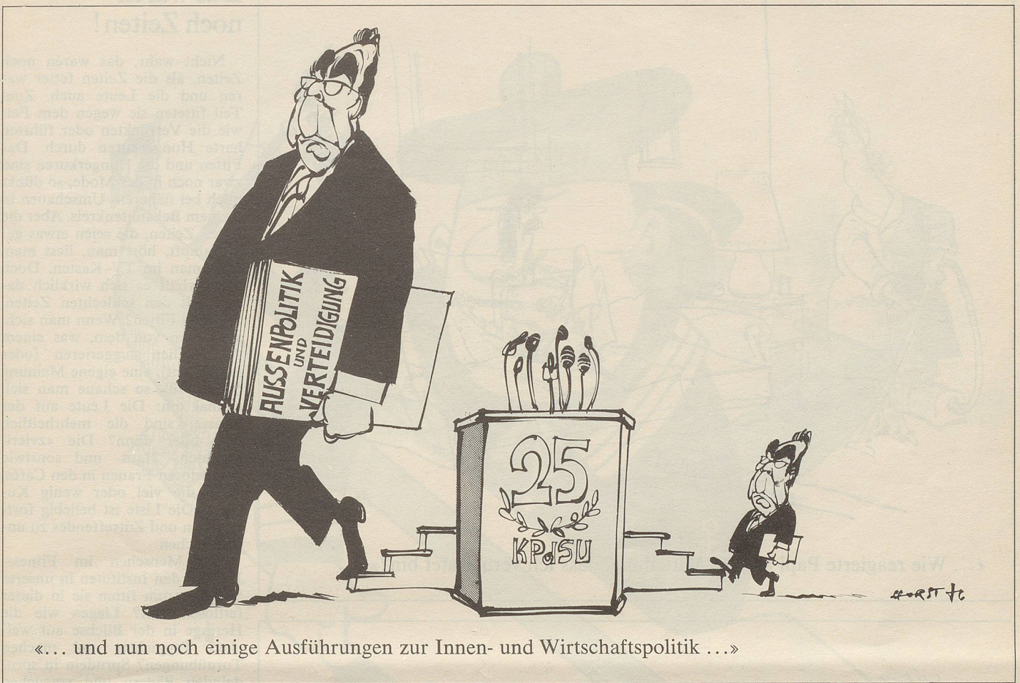
«... und nun noch einige Ausführungen zur Innen- und Wirtschaftspolitik ...»