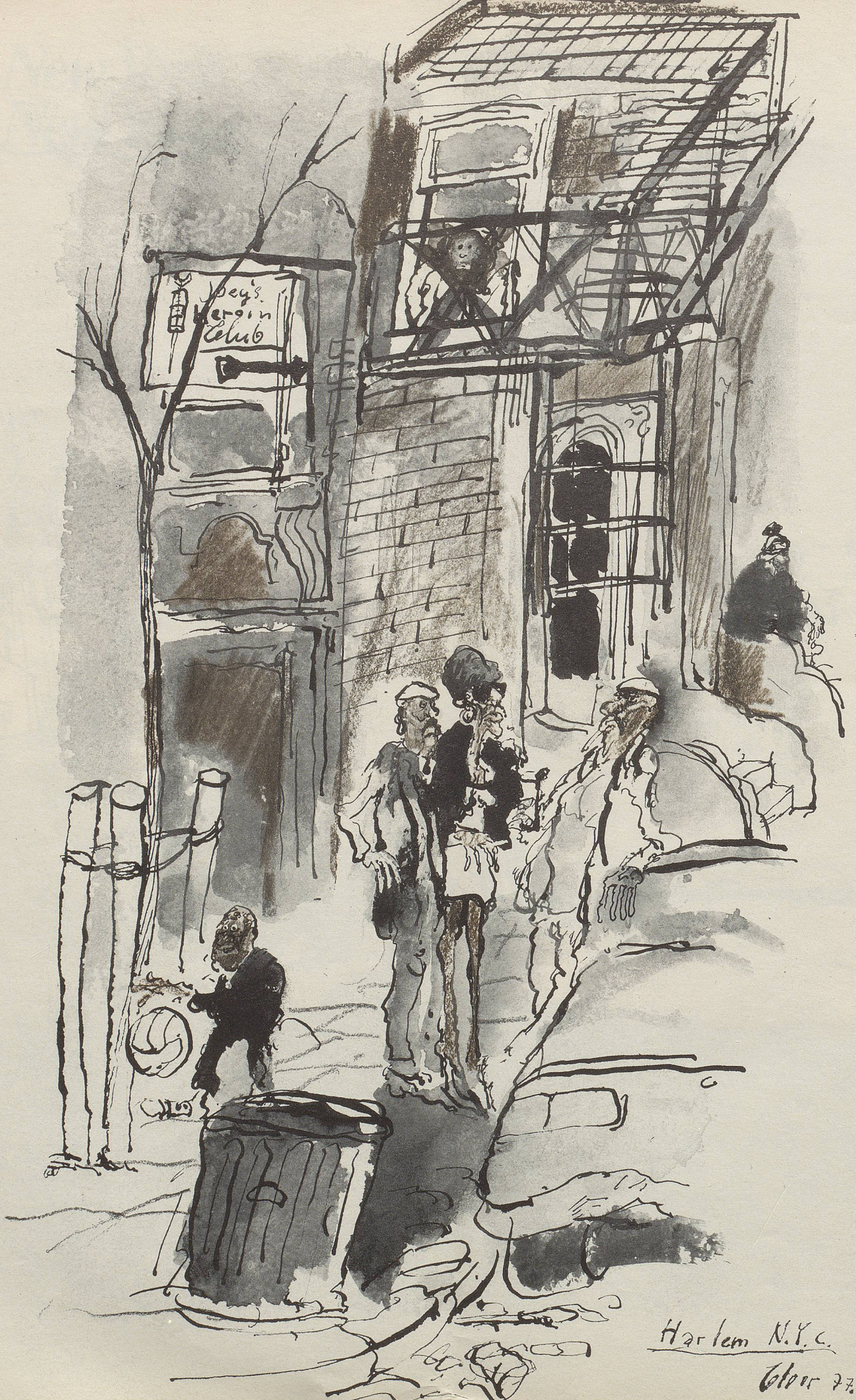
Harlem N.Y.C. Floor 77.