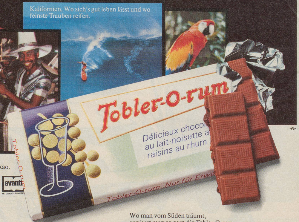
Wo man vom Süden träumt, genießt man so gern die Tobler-O-rum.

Die Trauben, der Rum und der Kakao. Gereift in der Sonne des Südens. Und mit Schweizer Alpenmilch vollendet nach exklusivem Tobler-Rezept.