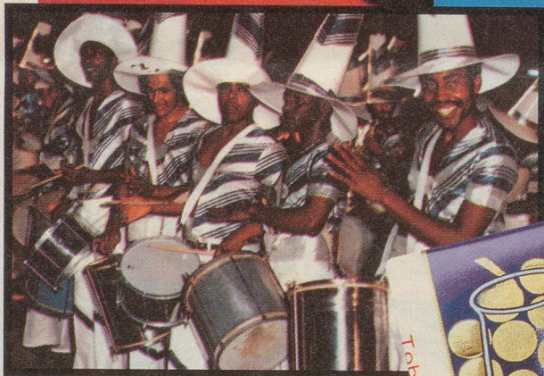
Bahia. Wo man das Lied singt «Ei, ei, ei Maria», dort wächst rassiger Kakao.

Kalifornien. Wo sich's gut leben lässt und wo feinste Trauben reifen.