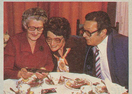
glücklich (klick). Nur ein bisschen erschöpft (klick) von den vielen Kerzen, die sie auf ihrem Geburtstagskuchen (klick) ausgeblasen hat.