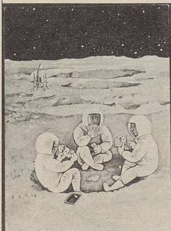
Wenn die Schweizer als Erste auf dem Mond gelandet wären...